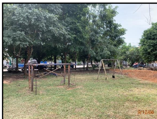
สนามเด็กเล่น