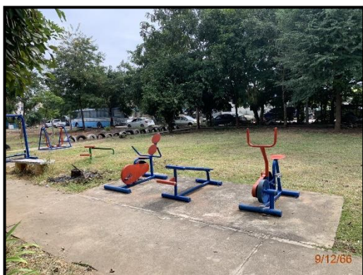
ลานออกกำลังกาย