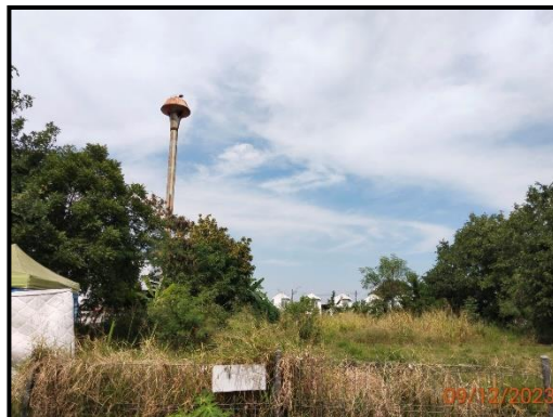
พื้นที่สำหรับใช้ประโยชน์ในอนาคต