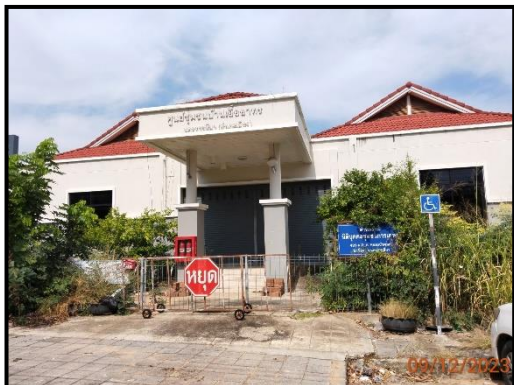
ศูนย์ชุมชน