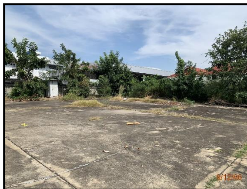
ลานค้าชุมชน