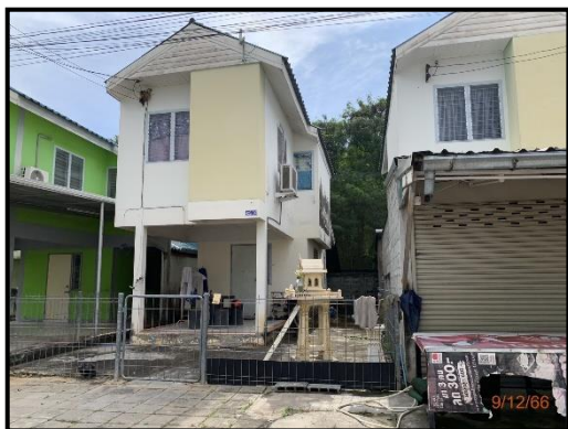
บ้านเดี่ยว 2 ชั้น