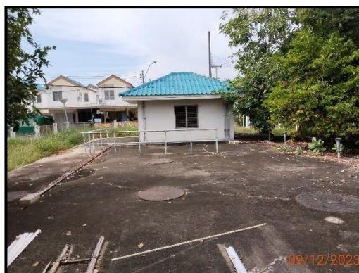
ระบบบำบัดน้ำเสียส่วนกลาง